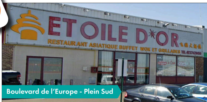
Boulevard de l'Europe - Plein Sud