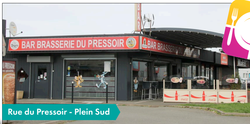
Rue du Pressoir - Plein Sud