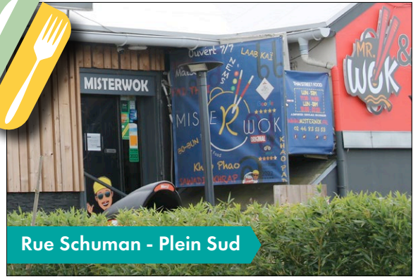
Rue Schuman - Plein Sud