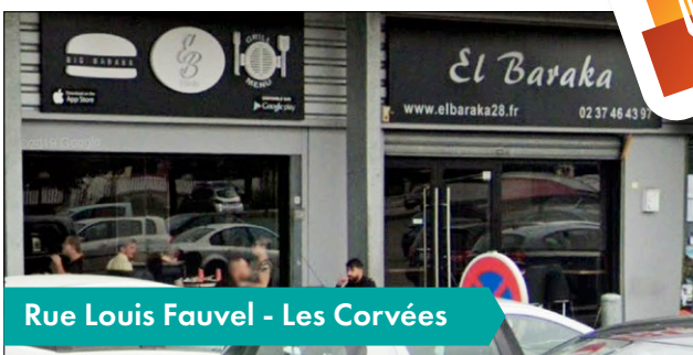
Rue Louis Fauvel - Les Corvées