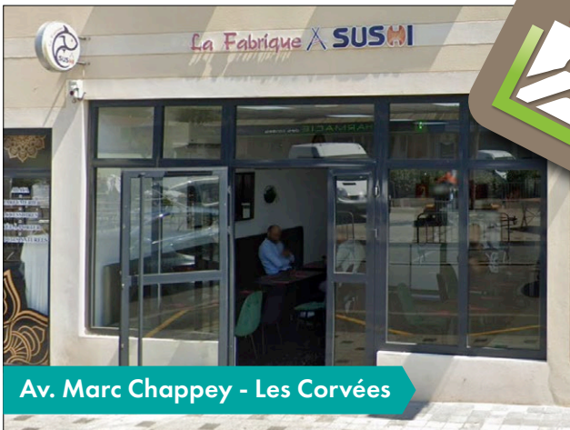
Av. Marc Chappey - Les Corvées