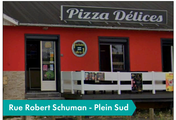
Rue Robert Schuman - Plein Sud