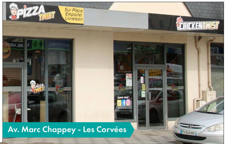
Av. Marc Chappey - Les Corvées