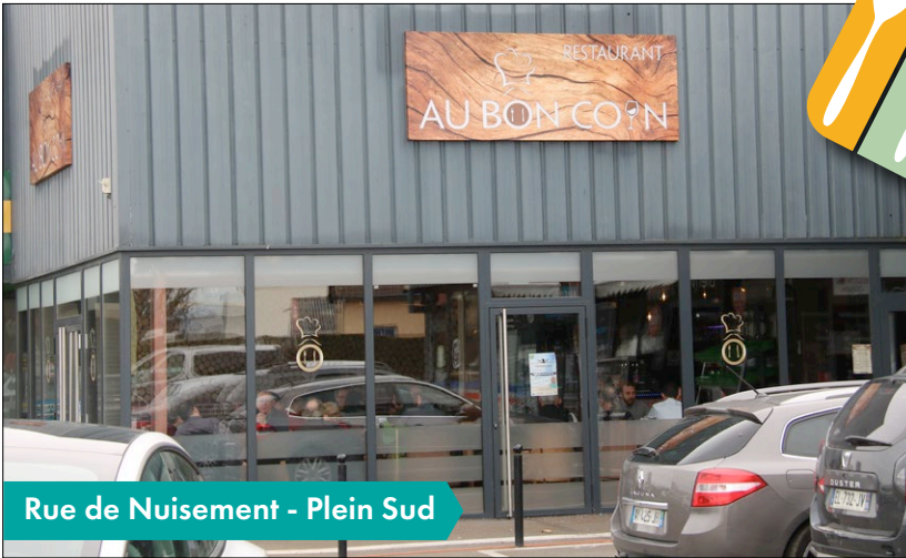
Rue de Nuisement - Plein Sud