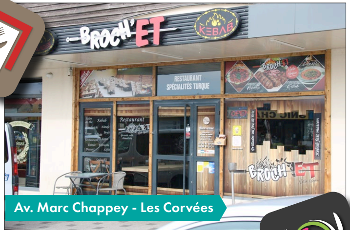
Av. Marc Chappey - Les Corvées