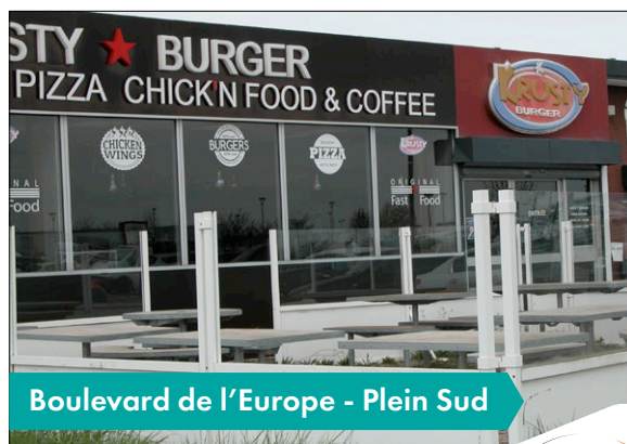
Boulevard de l'Europe - Plein Sud