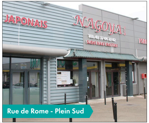
Rue de Rome - Plein Sud