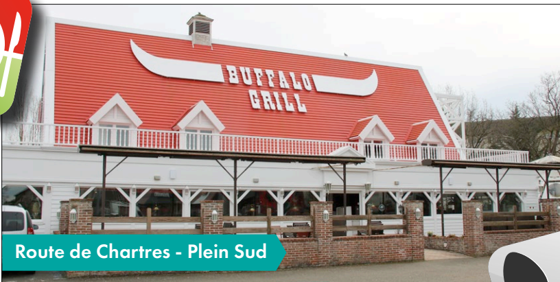
Route de Chartres - Plein Sud