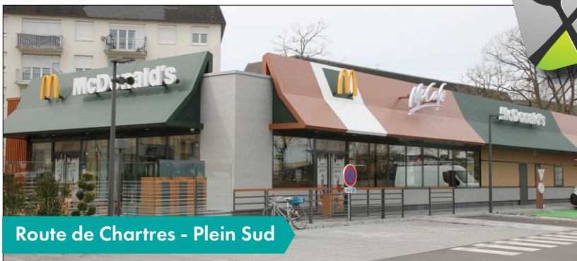
Route de Chartres - Plein Sud