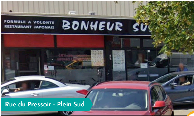
Rue du Pressoir - Plein Sud