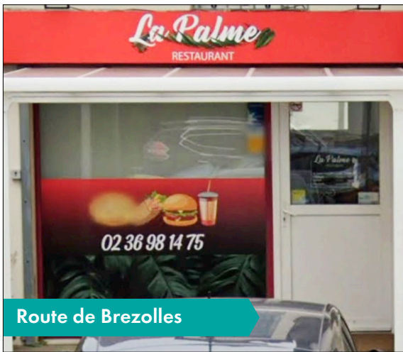
Route de Brezoles