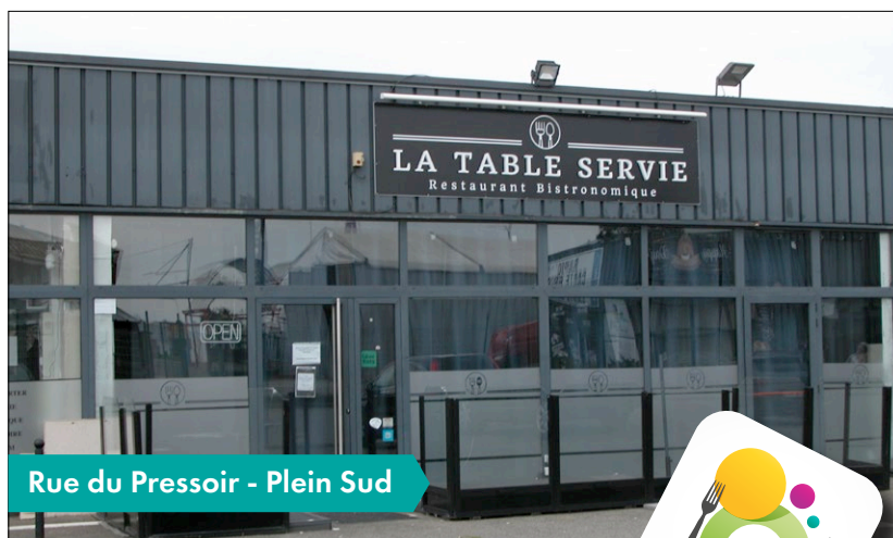
Rue du Pressoir - Plein Sud

Ces commerces de proximité vous accueillent midi et soir y compris le week-end pour une grande majorité d'entre eux. Alors n'hésitez pas et laissez vous tenter par la richesse culinaire proposée par ces restaurants.