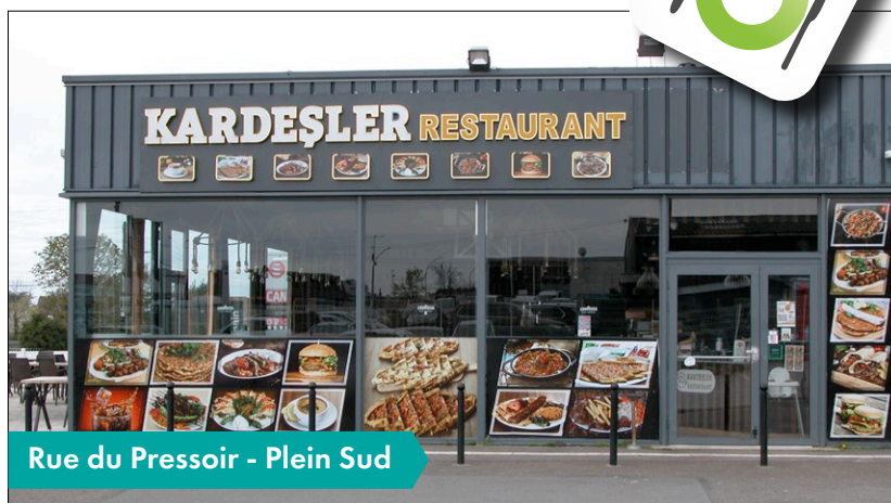
Rue du Pressoir - Plein Sud