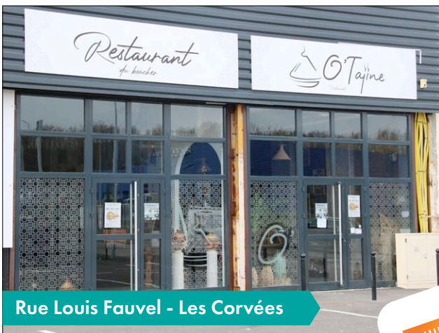
Rue Louis Fauvel - Les Corvées