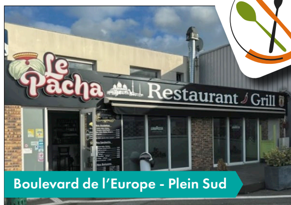
Boulevard de l'Europe - Plein Sud