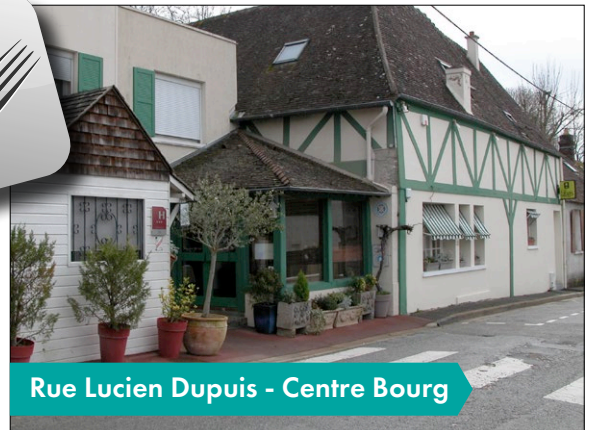
Rue Lucien Dupuis - Centre Bourg