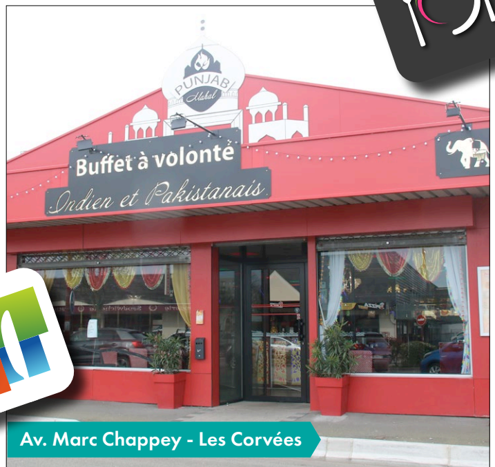
Av. Marc Chappey - Les Corvées